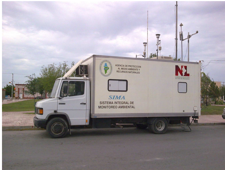
Figura. 1. Unidad Móvil de Monitoreo Ambiental en Cerralvo, N. L.

Durante el análisis realizado en Cerralvo, N. L. se monitorearon los siguientes parámetros: